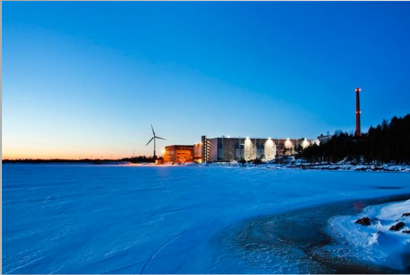
Google - Hamina, Finlandia