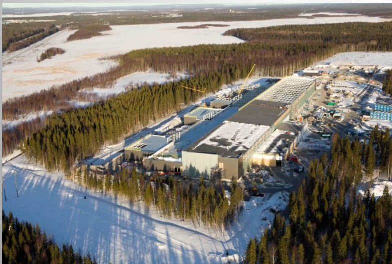
Facebook - Lulea, Szwecja